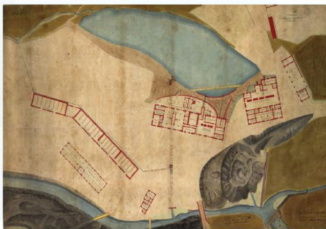
Mapa plánu hutě z 19. století