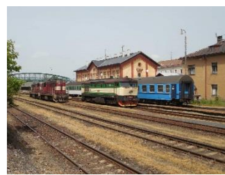
Vlakové nádraží (ŽST)

Zastávky Junior klub a Gymnázium jsou bez nástupiště, nástup je možný pouze na pokyn dopravce, prvními dveřmi ve směru jízdy vlaku.