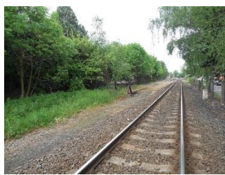
Gymnázium – spojnice mezi ulicemi Komenského a Klaudova Nástup od ulice Komenského