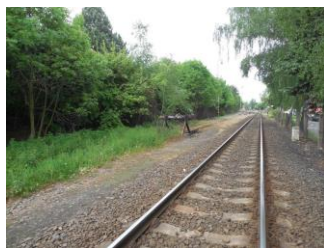
Gymnázium – spojnice mezi ulicemi Komenského a Klaudova Nástup od ulice Komenského