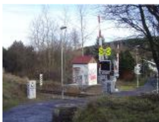
Junior klub – nástup na přechodu pro pěší