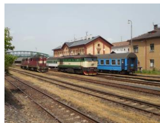
Vlakové nádraží (ŽST)

Přesnější popis umístění zastávek včetně větších fotografií nástupních míst je uveřejněn na www.kovopb.cz/beh-kovohutemi . Vlak má více zastávek, než měl autobus v minulých letech.